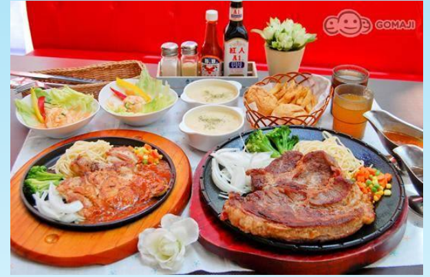
달러스 아메리카 스테이크